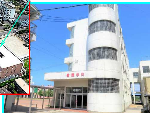
柳ヶ浦高等学校の全景