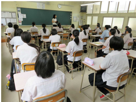
朝のホームルーム 活動